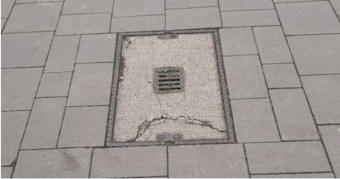
Schieberkappen und Hydranten mit Formsteinen: