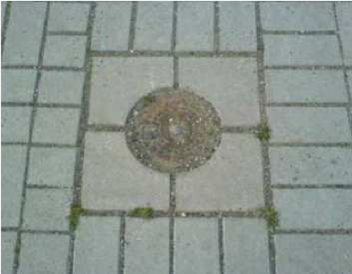
Umpflasterung mit Mosaik: