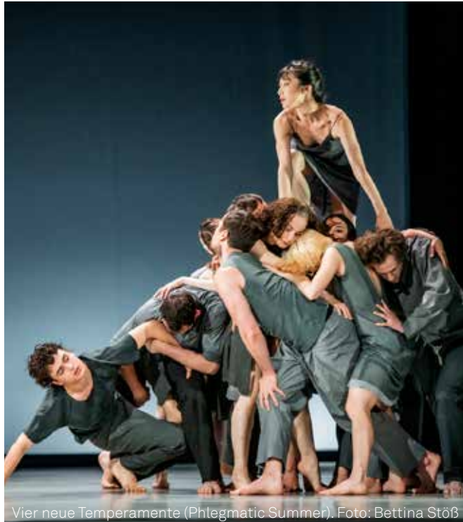
Vier neue Temperamente (Phlegmatic Summer).

IHR TERMIN: SO 30. OKTOBER 2022, 18.30 UHR