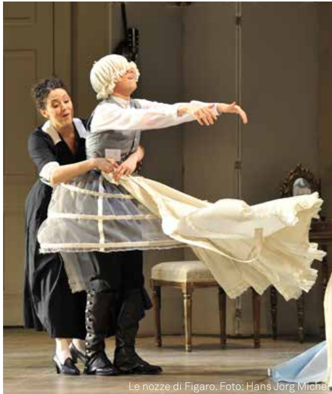
Le nozze di Figaro. Foto: Hans Jörg Michel

IHR TERMIN: FR 10. FEBRUAR 2023, 19.30 UHR