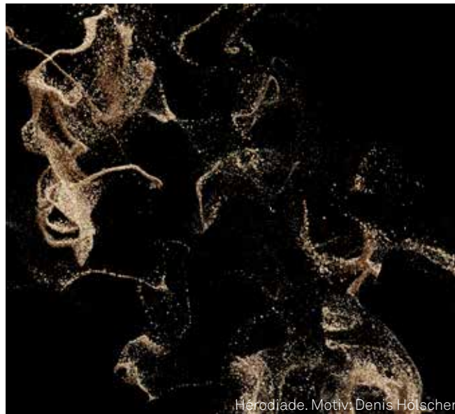
Hérodiade. Motiv: Denis Holscher