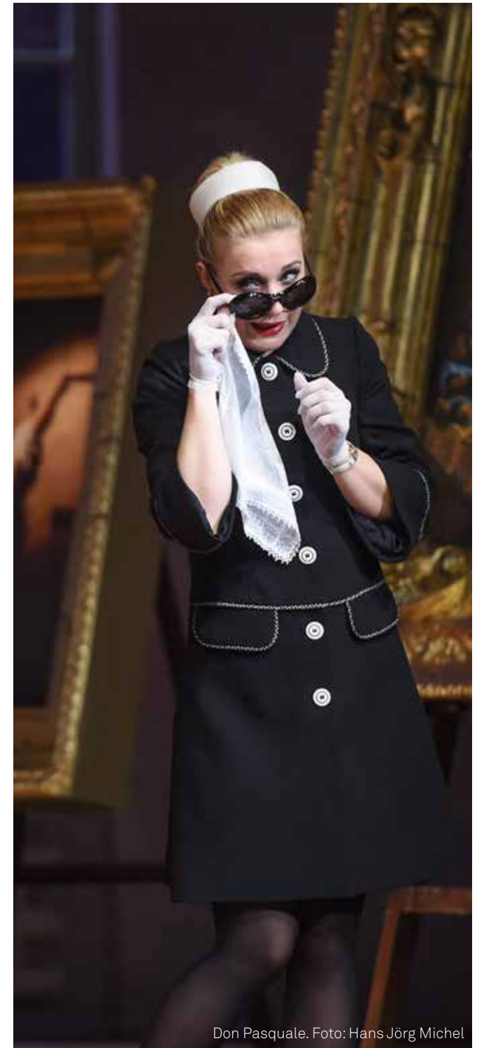
Don Pasquale.

IHR TERMIN: FR 27. JANUAR 2023, 19.30 UHR