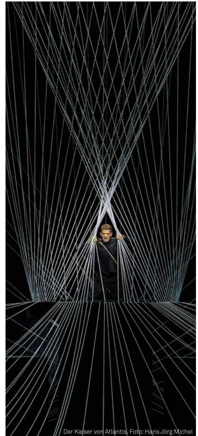
Der Kaiser von Atlantis.

IHR TERMIN: FR 28. APRIL 2023, 20.00 UHR